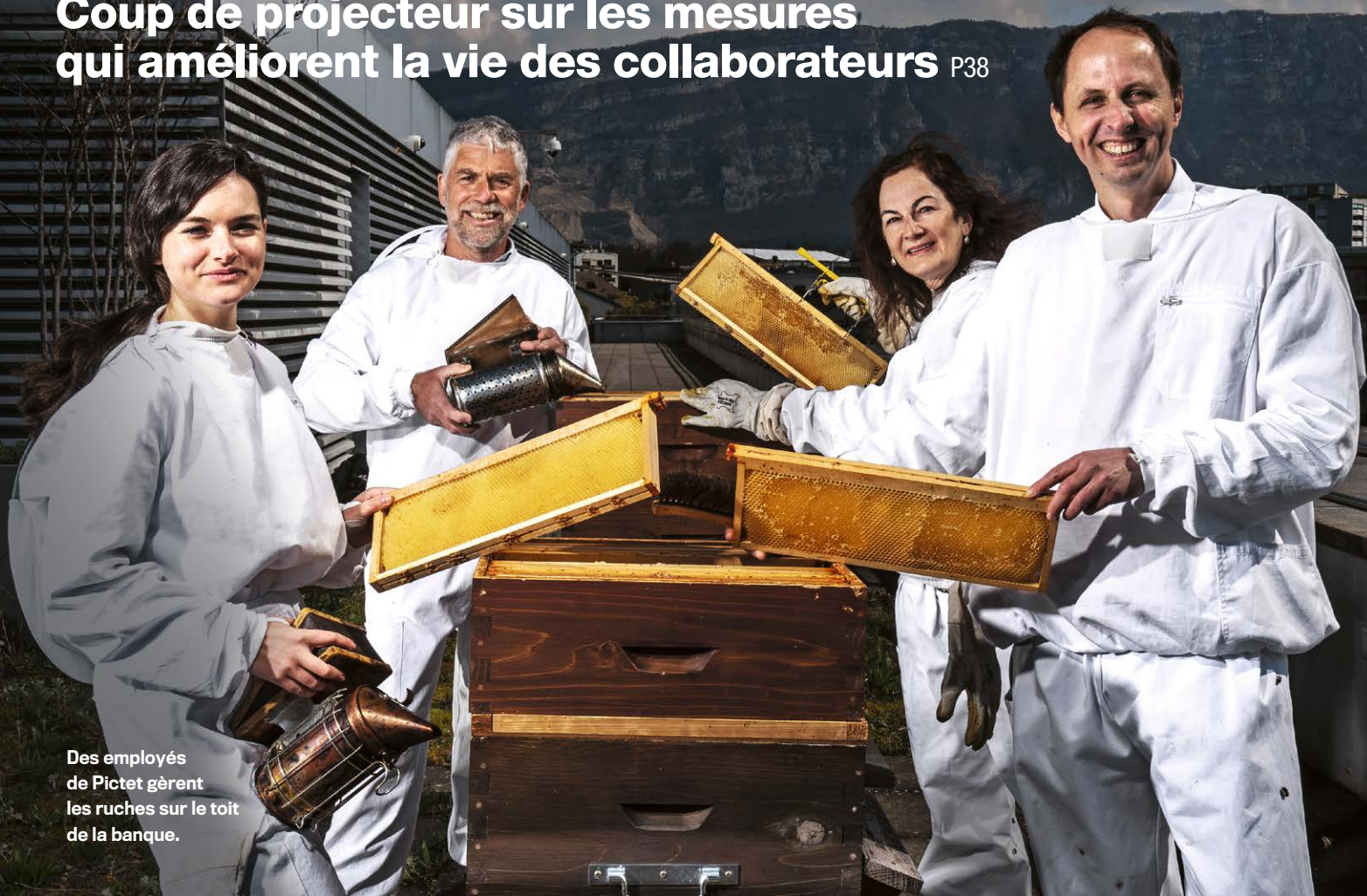
Des employés de Pictet gèrent les ruches sur le toit de la banque.

Coup de projecteur sur les mesures qui améliorent la vie des collaborateurs P38